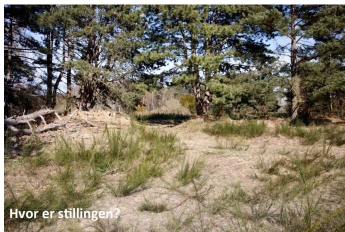
Hvor er stillingen?