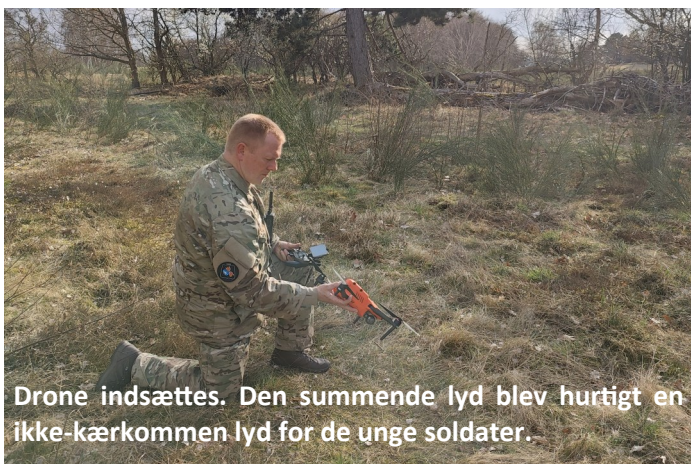
Drone indsættes. Den summende lyd blev hurtigt en ikke-kærkommen lyd for de unge soldater.

I ugen efter gennemførtes emnerne igen, men med skarp ammunition i geværrerne, da Livkompagniet var på skarpskydning i samme terræn.