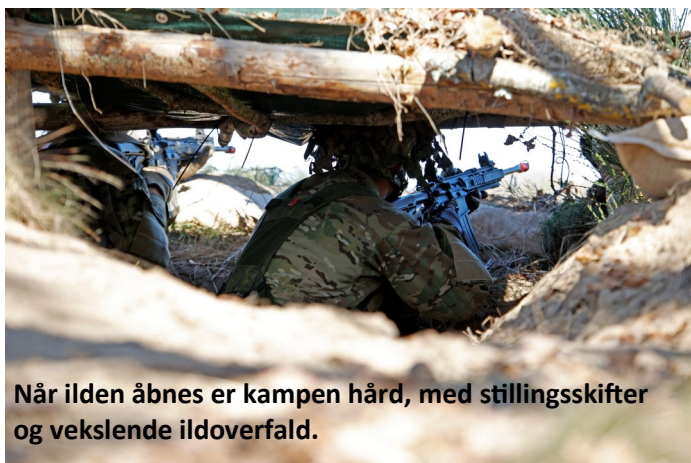
Når ilden åbnes er kampen hård, med stillingsskifter og vekslende ildoverfald.