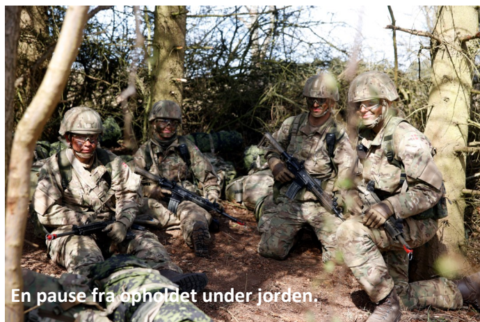
En pause fra opholdet under jorden.