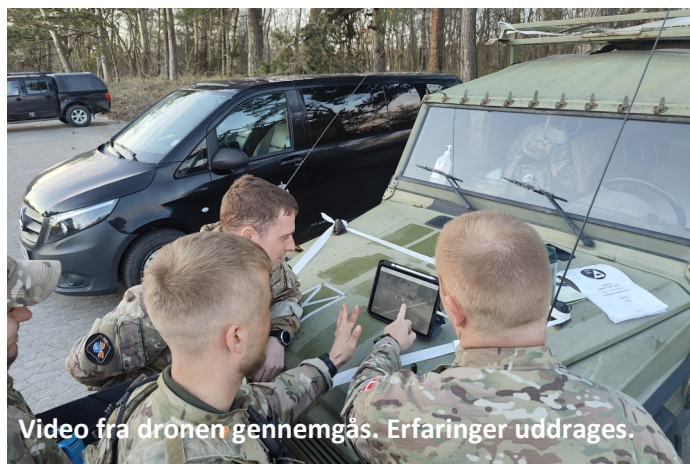
Video fra dronen gennemgås. Erfaringer uddrages.