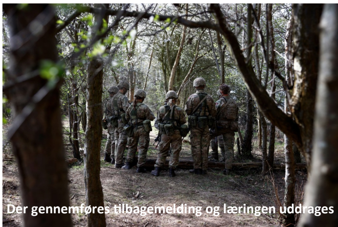
Der gennemføres tilbagemelding og læringen uddrages